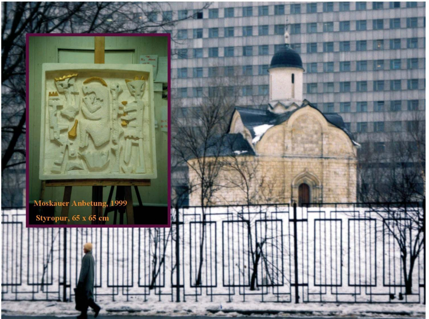
Moskauer Anbetung, 1999 Styropur, 65 x 65 cm