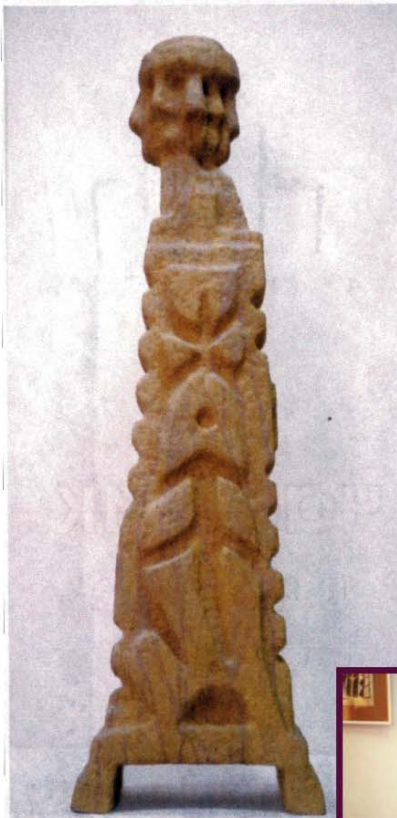
Watchtower, 1999 / 2000 Наблюдательный пункт Рармачее, Styropur h: ca 50 cm